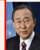
Генеральный секретарь Пан Ги Мун

«Благодаря своему особому акценту на ценностях кооперативы продемонстрировали, что представляют собой устойчивую и жизнеспособную экономическую модель, способную обеспечить процветание даже в трудные времена. Их успех позволил многим семьям и местным общинам избежать нищеты».